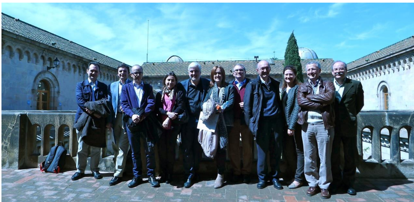
Participantes en la reunión RedIUM