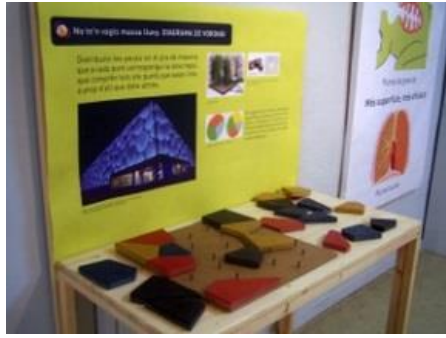
Módulo del MMACA

producen en diversas representaciones planas de la Tierra. Para cada proyección representada podemos visualizar la conservación de ángulos o de las áreas a partir de un cambio en el color del perímetro o interior.