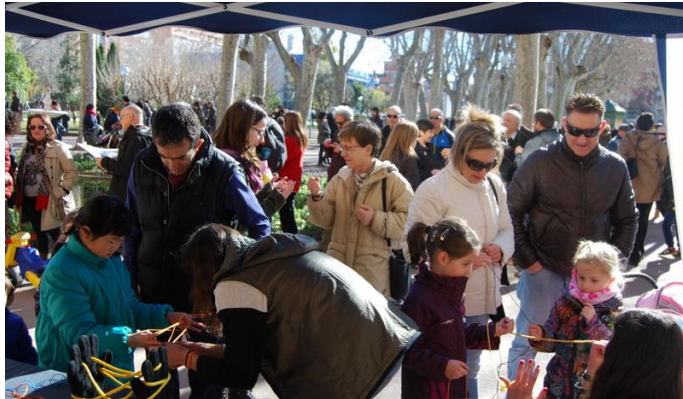
Diversos momentos de la exposición permanente del MMACA

Las visitas escolares han probado su enorme éxito entre el público infantil. Las sesiones abiertas al público general han demostrado que no sólo hay interés entre los escolares. Con las diferentes exposiciones de RSME-Imaginary, la comunidad RSME pudo comprobar la magnífica acogida que estas iniciativas tienen entre la comunidad matemática y el público en general. El proyecto del MMACA nos muestra, una vez más, que hay mucho por hacer en el terreno de la divulgación de las matemáticas en los diferentes niveles. Afortunadamente, es grato continuar comprobando que para estas iniciativas contamos con un público que las espera con entusiasmo.