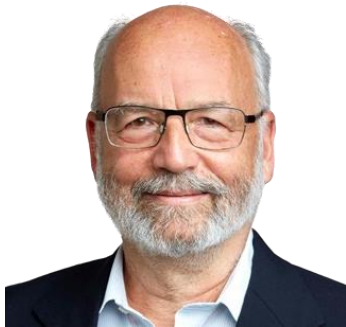
Adi Shamir.

Adi Shamir, profesor del Departamento de Ciencias de la Computación y Matemáticas Aplicadas del Instituto Weizmann (Israel), ha sido reconocido por “ser un científico verdaderamente excepcional y haber sido líder en la transformación de la criptografía en una disciplina científica fuertemente basada en las matemáticas”. La fundación Wolf añade en su anuncio que “sus descubrimientos fundamentales combinan el ingenio matemático con una variedad de herramientas analíticas que tuvieron un gran impacto en varias áreas matemáticas, haciendo avanzar tanto las matemáticas como la sociedad de una manera incomparable”.