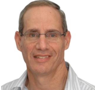
Noga Alon./ Fundación Wolf

ingeniosas en combinatoria, teoría de grafos e informática teórica, y la solución de problemas de big data en estos campos, así como en teoría analítica de números, geometría combinatoria y teoría de la información”.