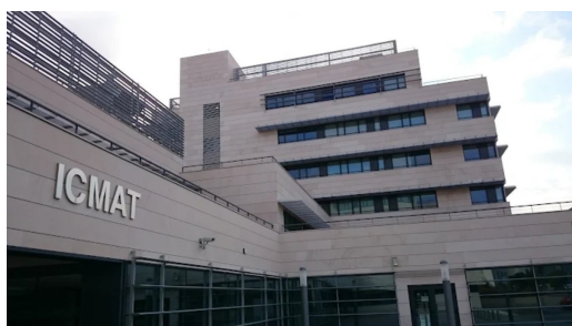
Sede del ICMAT en Madrid.

El Instituto de Ciencias Matemáticas (ICMAT) de Madrid, centro mixto formado por el Consejo Superior de Investigaciones Científicas y las universidades Autónoma de Madrid (UAM), Complutense de Madrid (UCM) y Carlos III de Madrid (UC3M), acogerá el próximo Congreso Bienal de la Real Sociedad Matemática Española (RSME), entre los días 17 y 21 de enero de 2028.