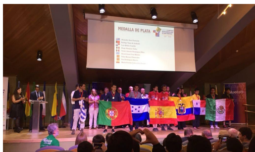
XL Olimpiada Iberoamericana de Matemáticas (Chile, 2025)

La Real Sociedad Matemática Española (RSME) ha trasladado a las más altas autoridades educativas del país una propuesta para que se incorporen medidas de reconocimiento académico para estudiantes con trayectorias de excelencia en olimpiadas científicas nacionales e internacionales.