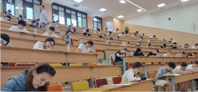
Alumnos examinándose de la PAU en 2025

Tranquilizar al alumnado de 2º de Bachillerato ante la Prueba de Acceso a la Universidad (PAU) es tarea casi imposible, y no por falta de recursos de gestión emocional: es complejo porque la fuente de ansiedad es real. La PAU determina el acceso a los grados universitarios públicos, y lo que está en juego no es solo una calificación, sino la trayectoria vital inmediata. Lo que sí alivia esa presión —y esto rara vez se pone sobre la mesa— es tener dinero suficiente para cos-